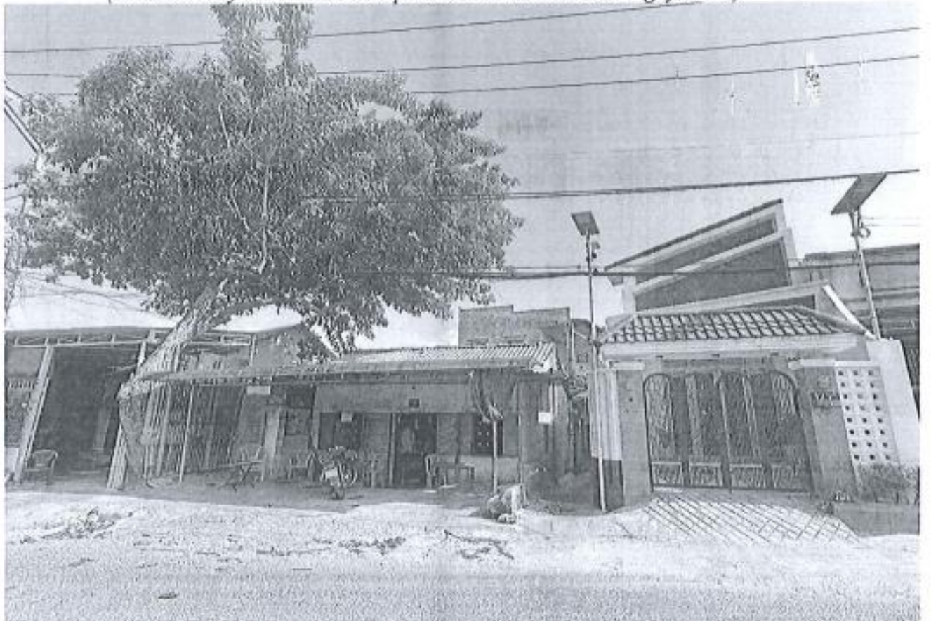
(Hình ảnh cây đã được xử lý và bỏ gọn cáp)